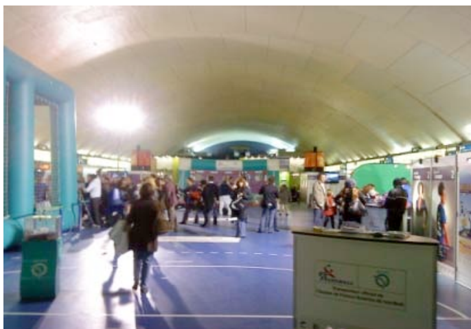
Création du Village Outre-mer - Station RER Auber

Le village restera ouvert jusqu'au samedi 25 septembre 2010.